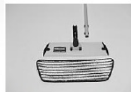
Jediný mop (microvlákna)