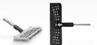
Dvoji mop (microvlákna)