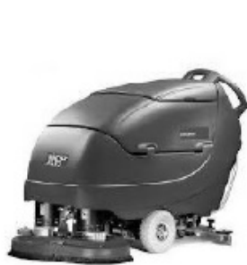
Automatický mycí stroj