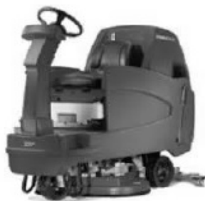
Pojízdný mycí stroj