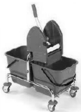
Vozík s dvojitým kýblem